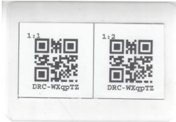
Figure 1 Example of duplicate label (SS-ID) to be added to each soil sample

سيقوم المشرف على البلد بإنشاء ملصقات لمعرفة عينة التربة (SS-ID) لجميع العينات التي سيتم أخذها داخل البلد وتوزيعها على فرق المسح لتسمية عينات التربة التي يجمعونها. سيتم إنشاء هذه الملصقات كرموز QR يمكن قراءتها آلياً (يتم استخدام رموز QR لأنها أسهل في القراءة) عدد الرموز الفريدة التي سيتم إنشاؤها هو ضعف عدد وحدات أخذ العينات المخصصة لبلده بالإضافة إلى 10٪ إضافية للنسخ الاحتياطي المقاصد. يجب أن تكون الملصقات ثابتة، بحيث لا تتمزق بسهولة وتتجدد ويجب أن تكون مقاومة للماء. لهذا الغرض، ستتم طباعة الملصقات على ورق كرتون عالي الجودة 300 جرام في المتر المربع وسيتم تصفيح الملصقات باستخدام "فيلم تصفيح (كيس) بطاقة الهوية صغير الحجم" المتاح بشكل عام؛ هذا فيلم تصفيح مقطوع إلى أبعاد 70 x 100mm. سيتم إنشاء الملصقات من نسختين وتصفيح كتسمية مكررة واحدة. يتم إعطاء مثال في الصورة أدناه